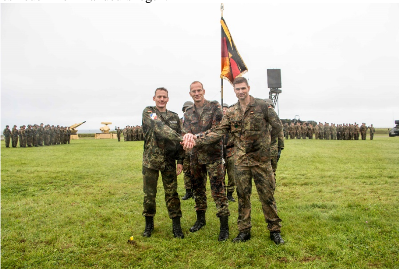
Bild 10 Gratulation nach der Kommandoübergabe

Bei unüblichem regnerischem Wetter waren Soldatinnen und Soldaten der Flugabwehrraketengruppe 61 auf dem Mantis Schießplatz in Todendorf an der schleswig-holsteinischen Ostsee angetreten und verabschiedeten ihren erst dritten Kommandeur. Der erste Kommandeur der FlaRakGrp 61 durfte jetzt als Kommodore seine alte Gruppe in die Verantwortung eines neuen Kommandeurs legen.